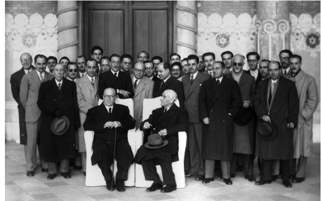
Figura 2. Sesión inaugural de la Sociedad Española de Neurología. 19 de diciembre de 1949. Archivo Histórico de la SEN.

La presencia de Jean-Alexandre Barré presidiendo la sesión inaugural representó la influencia francesa en el ámbito de la neurología española. En esta sesión, disertaron algunos de los primeros socios de la SEN, junto a