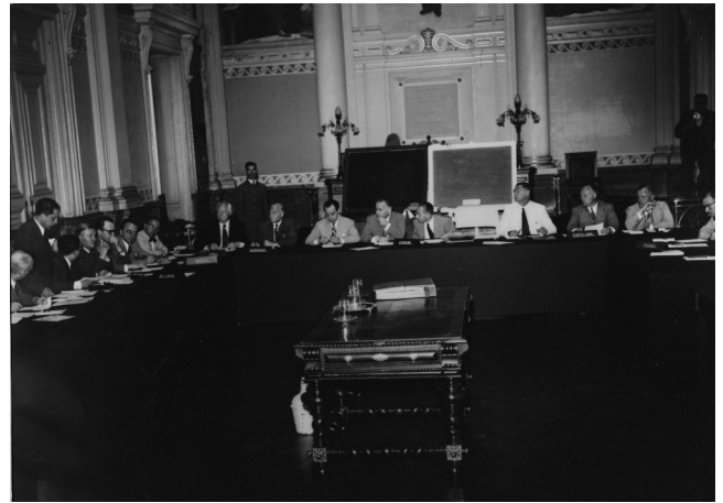
Figura 3. Reunión de delegados, preparatoria del VI Congreso Internacional de Neurología.

Los componentes del Comité oficial español en los Congresos Internacionales de Neurología fueron nombrados por la Dirección General de Sanidad, dependiente del Ministerio de Gobernación, a partir de 1944 (tabla 2). El nombramiento se efectuaba sin la participación de la SEN, tal y como se recogía en sus Estatutos, por lo que se protestó enérgicamente ante estos nombramientos. Por otra parte, la dirección del propio Congreso nombraba directamente los delegados de cada uno de los países 16 .